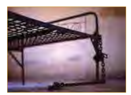
គ្រែអ្នកទោសនៅសារមន្ទីរទូលស្លែង

ទៅទៀត អ្នកឆ្លើយសំណូរភាគច្រើនបានរាយការណ៍ថា បានដឹង ពីករណីជាច្រើន ឬទម្រង់ជាច្រើននៃអំពើហិង្សាលើយេនឌ័រប្រភេទ នេះ។ ទោះបីជារបាយការណ៍ភាគច្រើន និយាយថាបានឃើញ ភស្តុតាងនៃអំពើហិង្សានេះនៅលើខ្លួនប្រាណសាកសព ឬសាកសព ត្រូវគេកាត់ប្រដាប់ភេទចោលក៏ដោយ ក៏អ្នកឆ្លើយសំណូរមួយចំនួន តូចក៏បានរាយការណ៍ផងដែរថា បានឃើញទង្វើទាំងនេះកើតឡើង ក្នុងសម័យនោះ។